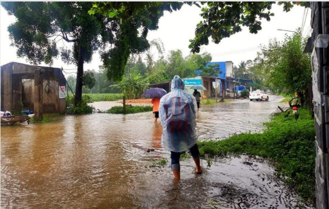
Đoàn khảo sát tại Quảng Nam gặp lụt đột xuất