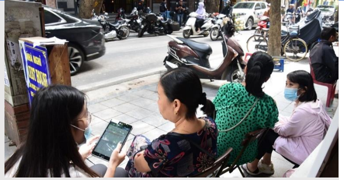
Short clip of the PAPI field team's fieldwork in Ha Noi for 2020 PAPI