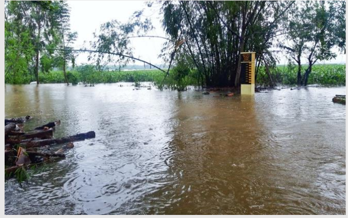
Fieldwork in Quảng Nam Facing Sudden Floods