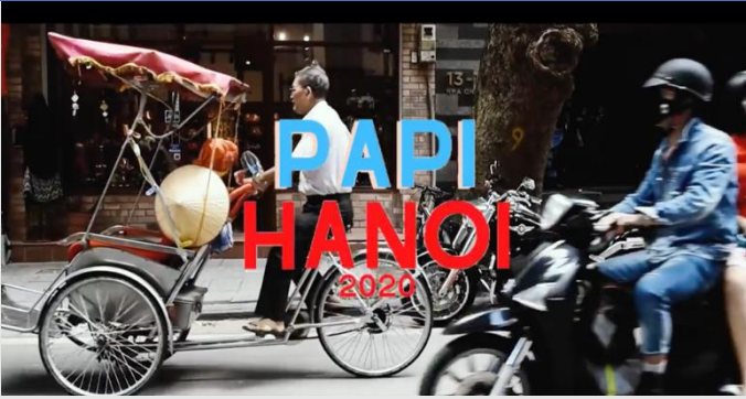
Phim ngắn về đoàn khảo sát PAPI 2020 trong hành trình tại Hà Nội