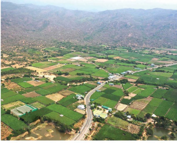
Slow progress in online disclosure of land information by local governments, and strengthened land transparency regulations much needed: action research results show

Domestic delivery VND 47,000 | Overseas delivery USD 3.80