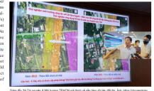
Sản phẩm 3D từ nghiên cứu và phân tích thực địa về việc ứng dụng đất đai.

These research findings come from the action research "2022 Review of Local Governments' Performance in Disclosure of District Land Use Plans and Provincial Land Use Planning Frameworks", which was jointly commissioned by the United Nations Development Program (UNDP) in Vietnam, the Center for Education Promotion and Empowerment of Women (CEPEW) and Real-Time Analysis (RTA) from late 2022 to mid-2023. This study is part of an annual